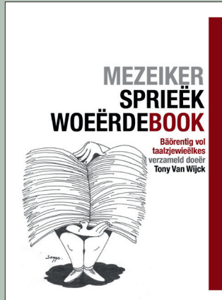
Het ierste deil (deel 1) 2014