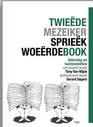
Het twieëde deil (deel 2) 2020